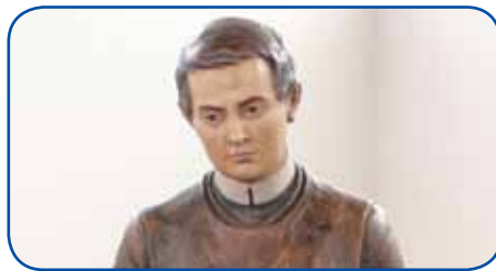
Ordensgründer Peter Friedhofen

über die Geschichte(n) des „St. Petrus-Krankenhauses“ bis zum christlichen Krankenhaus in der heutigen Gesellschaft. „Ist da drin, was dran steht...?“, fragte